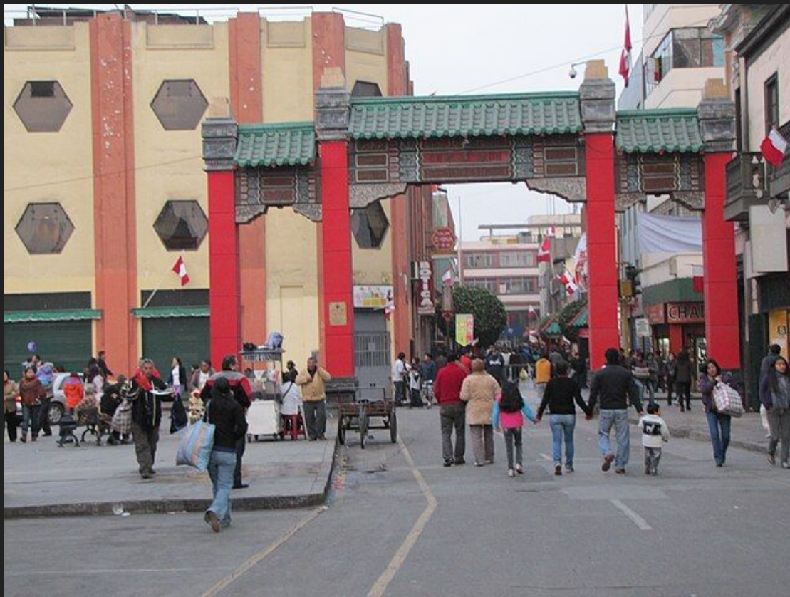
Barrio Chino, Lima, Peru