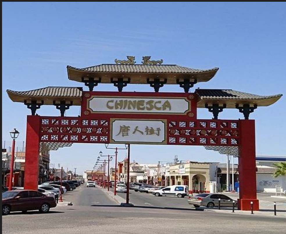
Entry Gates to La Chinesca, Mexicali, Mexico