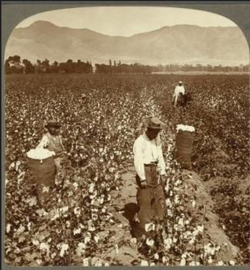
Chinese laborers in Peru, circa 1900