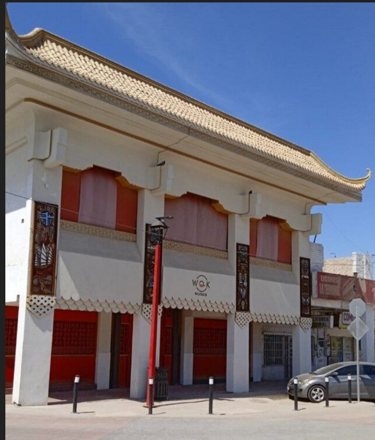
Entry Gates to La Chinesca, Mexicali, Mexico