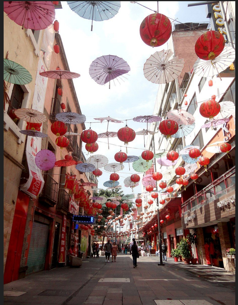
Barrio Chino, Mexico City, Mexico