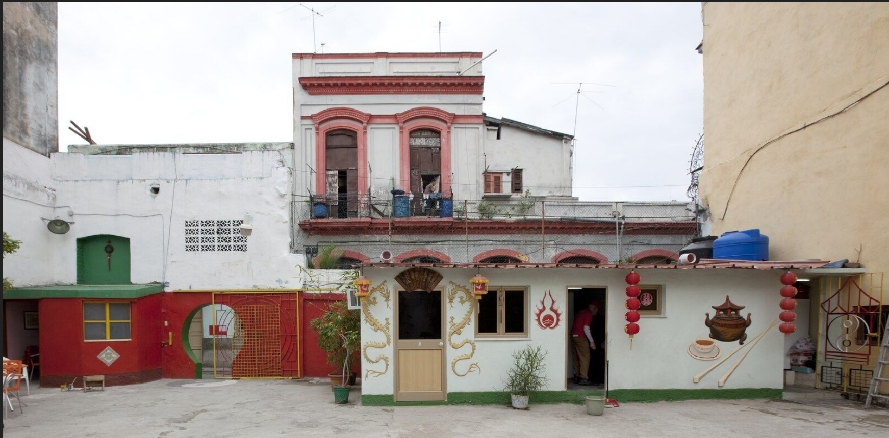
Barrio Chino, Havana, Cuba