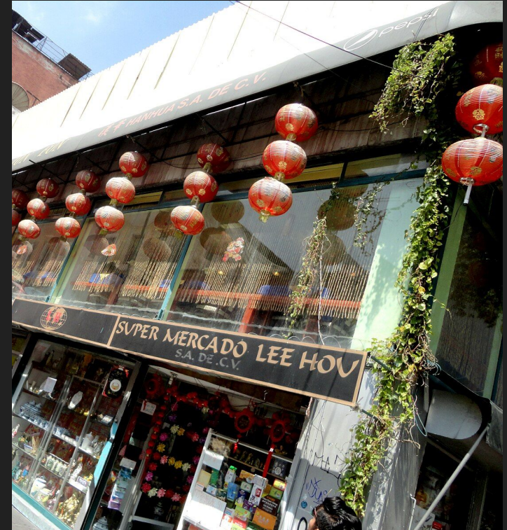
Barrio Chino, Mexico City, Mexico