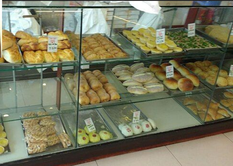
Barrio Chino, Lima, Peru