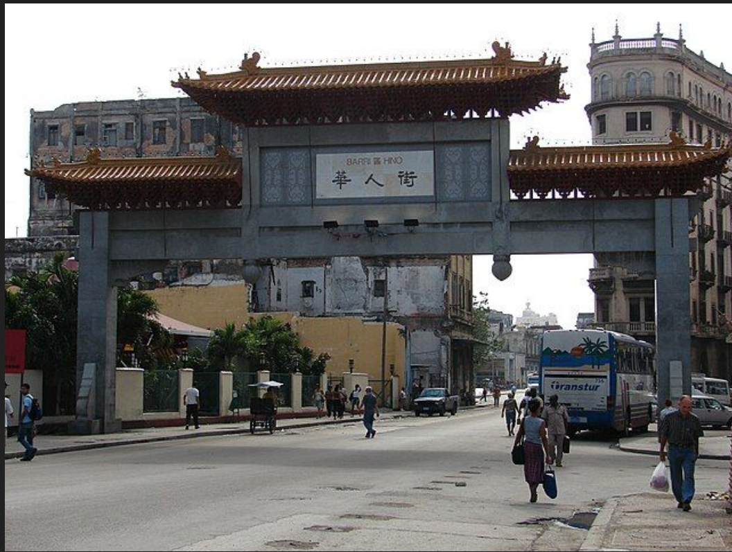
Barrio Chino, Havana, Cuba