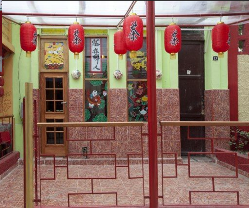
Barrio Chino, Havana, Cuba